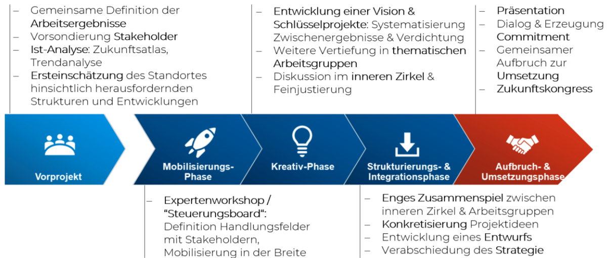
Abbildung 2: Zusammenfassende Übersicht vom Projektstart bis zur Umsetzung

Das geplante Vorgehen des Gesamtprozesses sieht wie folgt aus: